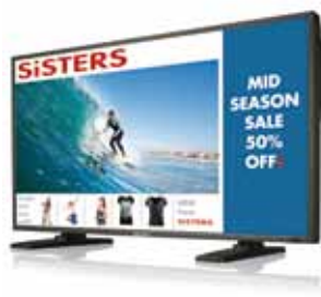
BDL4251V (42") BDL4651VH (46")