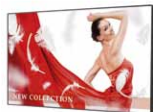
BDL4675XU (46") BDL4681XU (46")