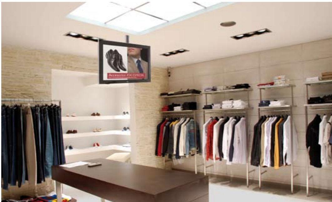
Señalización digital en tiendas y centros comerciales

CREE EL MENSAJE Promocione sus productos y servicios. Informe a sus clientes y colaboradores. Potencie su marca y/o su identidad corporativa.