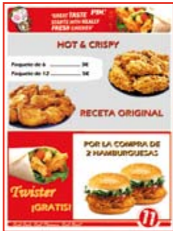
Señalización digital en restaurantes y lugares de ocio

Adapte el contenido en función de su público objetivo. Fidelice a sus clientes. Llegue a más público de forma eficaz.