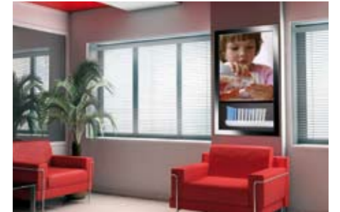
Uso de pantalla de plasma en vertical