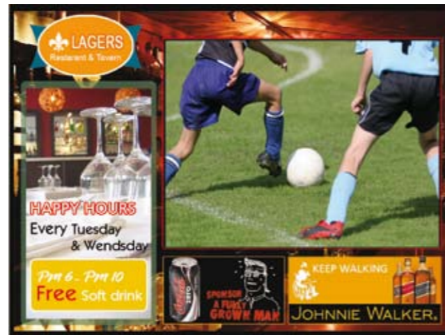
Muestra de plantilla generada por el sistema