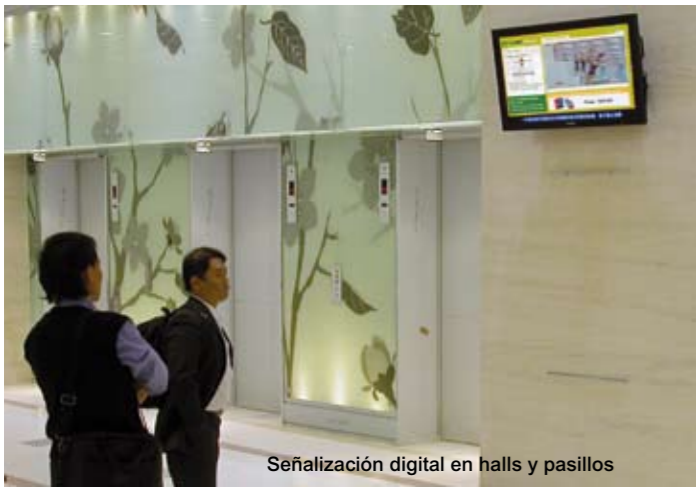
Señalización digital en halls y pasillos