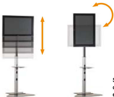
Señalización digital con soporte regulable en altura y orientación