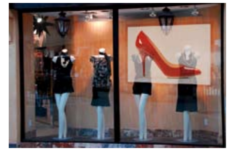
Uso de proyección en escaparate