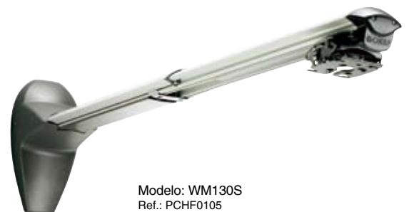
Modelo: WM130S Ref.: PCHF0105