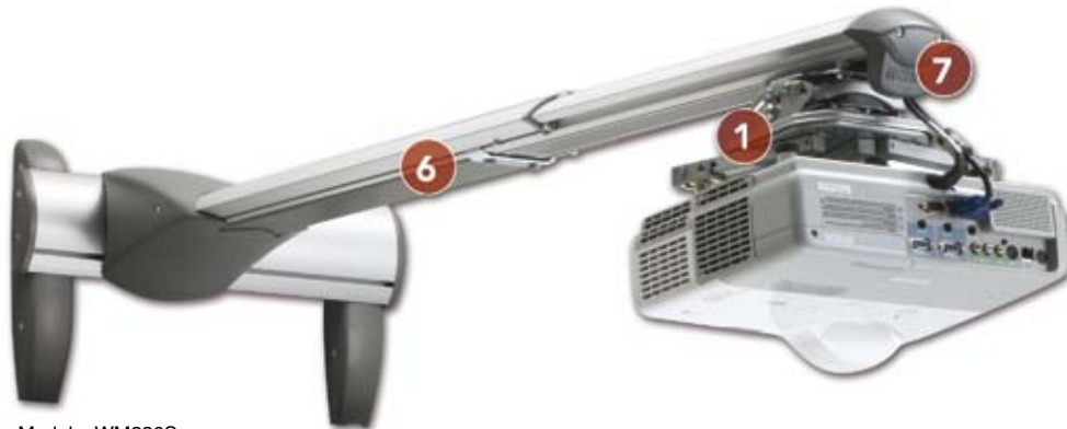
Modelo: WM230S Ref.: PCHF0106

Nuestra amplia gama de soportes de pared universales para proyectores de corto alcance proporcionan una flexibilidad, precisión y robustez inigualables. Garantizan instalaciones rápidas, seguras y con una precisa alineación.