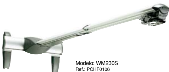
Modelo: WM230S Ref.: PCHF0106